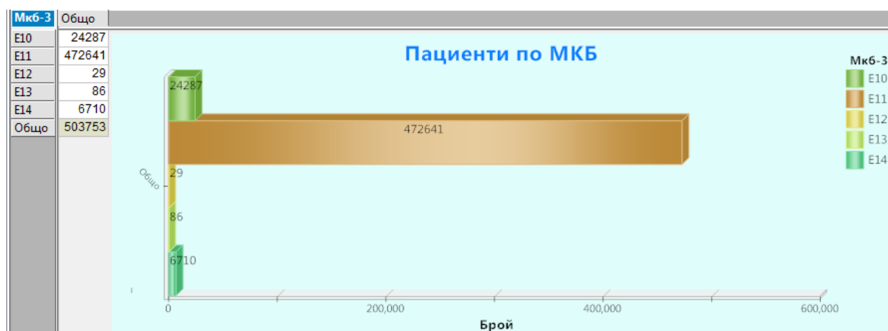
Фиг. 1 Разпределение по МКБ-10

Броят на починалите пациенти със захарен диабет за анализирания период е 26 813, 18 641 от които са имали визита при лекар през 2018 г.