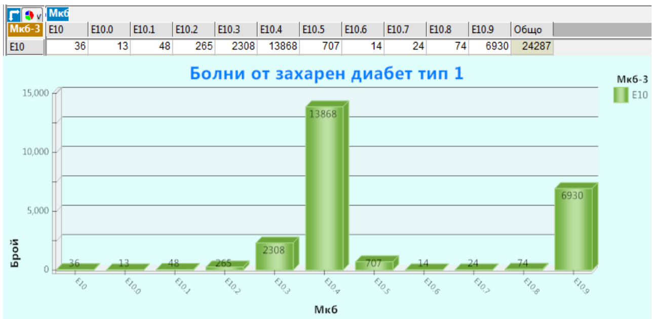
Фиг. 2 Разпределение на болните от захарен диабет тип 1 с усложнения на диабета