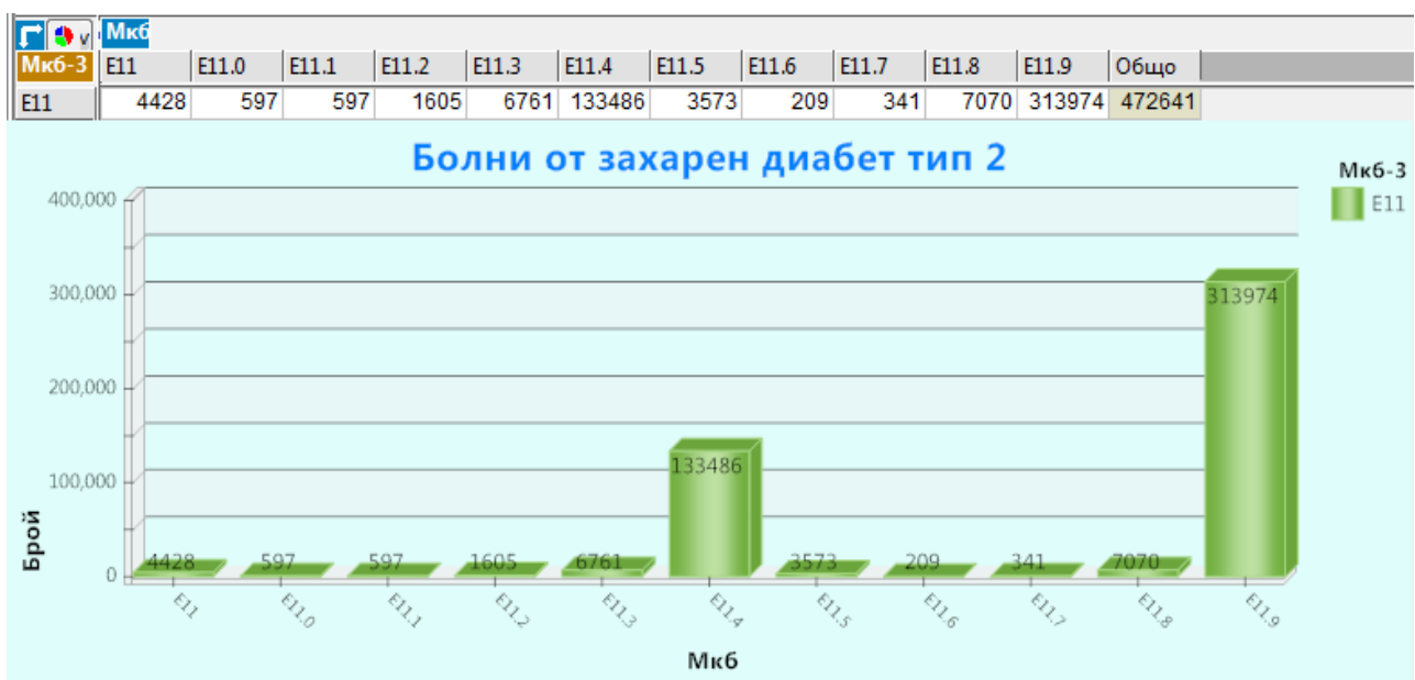
Фиг. 3 Разпределение на болните от захарен диабет тип 2 с усложнения на диабета